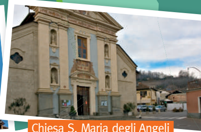
Chiesa S. Maria degli Angeli