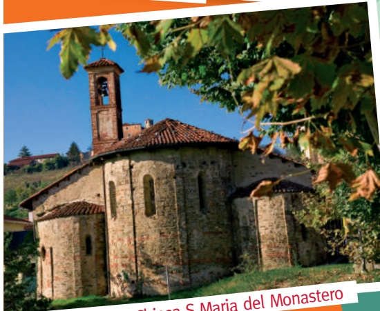
Chiesa S. Maria del Monastero