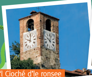
'l Cioché d'le ronsee